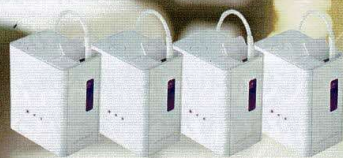
ポータブル水素吸入器ラブリエエラン2