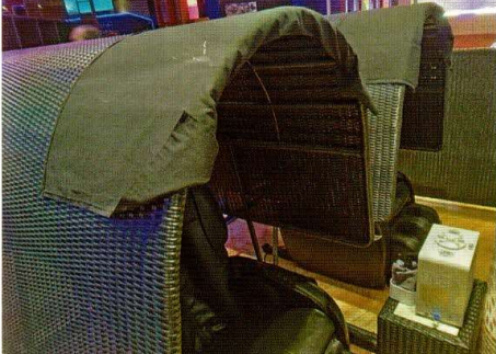
マッサージと水素吸入ができるブース

水素の有用性に理解の高い経営者が運営するアッティーボジムでは、水素吸入器の扱い方や機能性に対するスタッフへの研修もきちんと行われているという。さらに、会員向けには、毛細血管スコープを用いて水素吸入前後の血流を観察するイベントなど、水素吸入ユーザーの裾野拡大に繋がる取り組みにも注力している。「好評の水素会員を今後もさらに拡大していきたい」と意気込む。水素素材市場の拡大の観点からも、アッティーボジムの取り組みから、今後も目が離せない。